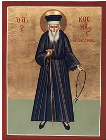
St. Kosmas Aitolos (1714-1779)

The holy, glorious and right-victorious New Hieromartyr and Equal-to-the-Apostles Kosmas Aitolos (also known as Cosmas Aitolos , and St Cosmas the Aetolian ) was born in 1714 in Mega Dendron, Aitolia, Greece, to a father who was a weaver and a devout mother.