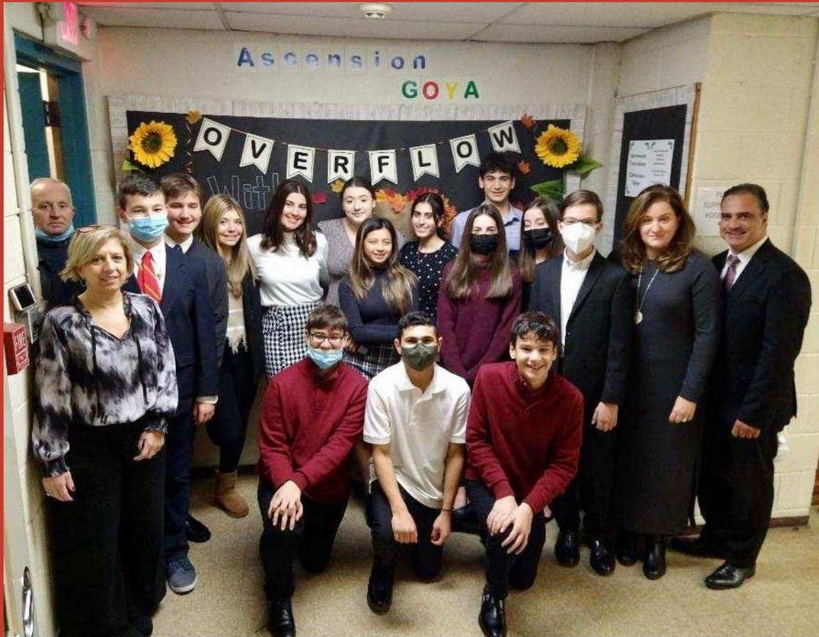
The Ascension GOYA (Greek Orthodox Youth of America) serve our church on Sunday, November 28, 2021.

The Ascension Catechism Program is sponsoring a Christmas Shop. Please support their first FUNDRAISER. All proceeds will go to two Orthodox organizations, St. Basil Academy, Garrison, NY and St. Tabitha School & Orphanage, Kenya, Africa. The Christmas Shop will be available on December 5, 8, 12, & 15 so you may purchase gifts for the holidays!